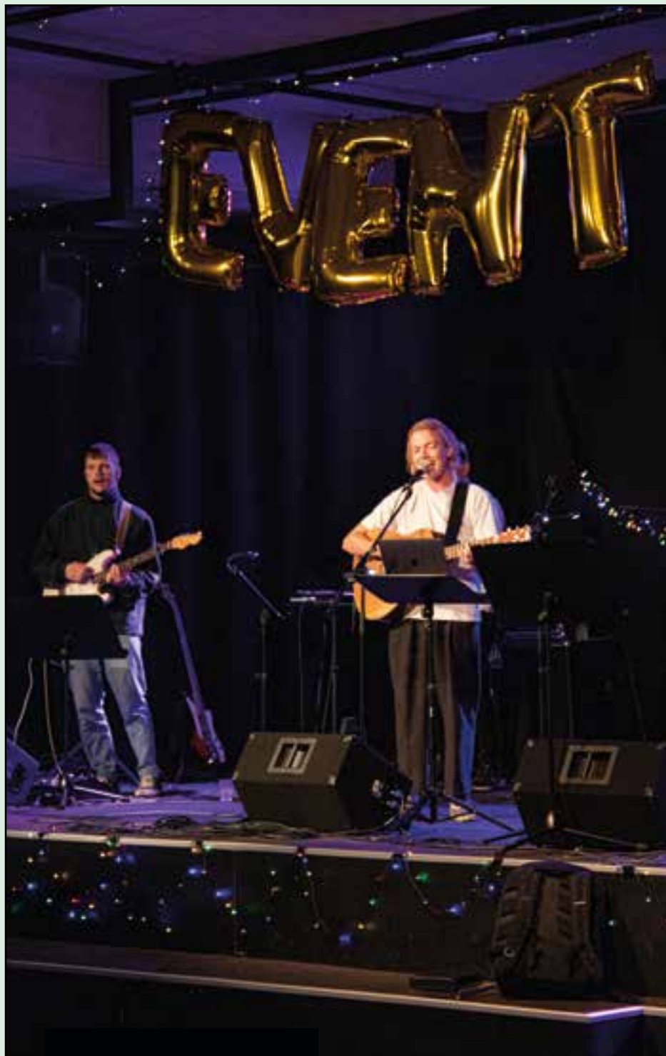
Lovsang på Event på Sydvestjyllands Efterskole